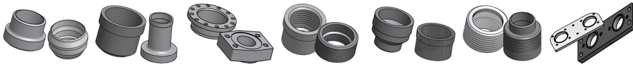
Conexão Soldável Conexão Soldável Conexão Flangeada Conexão Roscada Conexão Victaulic Conexão Combo Conexão de Placa

*Para obter as dimensões específicas, ou informações sobre outros tipos de conexões, por favor, entre em contato com seu representante de vendas SWEP.