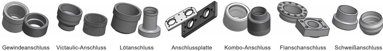
Gewindeanschluss Victaulic-Anschluss Lötanschluss Anschlussplatte Kombo-Anschluss Flanschanschluss Schweißanschluss

*Spezifische Abmessungen und weitere Informationen über andere Anschlussarten erhalten Sie von Ihrem SWEP-Handelsvertreter.