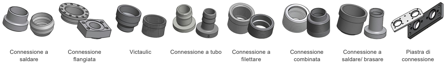
Connessione a saldare