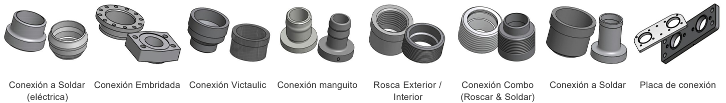
Conexión a Soldar (eléctrica) Conexión Embridada Conexión Victaulic Conexión manguito Rosca Exterior / Interior Conexión Combo (Roscar & Soldar) Conexión a Soldar Placa de conexión

*Para dimensiones específicas o para obtener información sobre otros tipos de conexiones, póngase en contacto con su representante de ventas de SWEP.