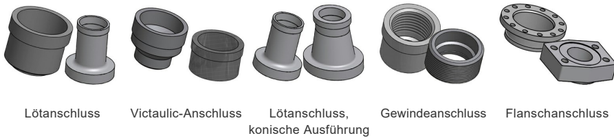
Lötanschluss Victaulic-Anschluss Lötanschluss, konische Ausführung Gewindeanschluss Flanschanschluss

*Spezifische Abmessungen und weitere Informationen über andere Anschlussarten erhalten Sie von Ihrem SWEP-Handelsvertreter.