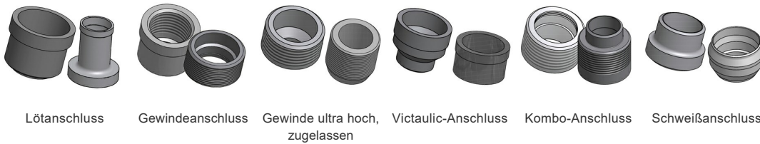
Lötanschluss Gewindeanschluss Gewinde ultra hoch, zugelassen Victaulic-Anschluss Kombo-Anschluss Schweißanschluss

*Spezifische Abmessungen und weitere Informationen über andere Anschlussarten erhalten Sie von Ihrem SWEPE-Handelsvertreter.