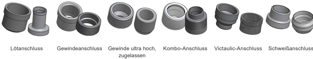
Lötanschluss Gewindeanschluss Gewinde ultra hoch, zugelassen Kombo-Anschluss Victaulic-Anschluss Schweißanschluss

*Spezifische Abmessungen und weitere Informationen über andere Anschlussarten erhalten Sie von Ihrem SWEP-Handelsvertreter.