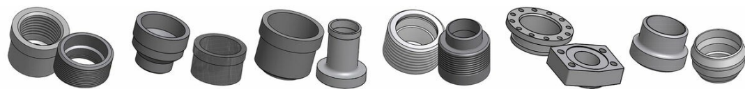
Conexão Roscada Conexão Victaulic Conexão Soldável Conexão Combo Conexão Flangeada Conexão Soldável

*Para obter as dimensões específicas, ou informações sobre outros tipos de conexões, por favor, entre em contato com seu representante de vendas SWEP.