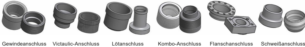
Gewindeanschluss Victaulic-Anschluss Lötanschluss Kombo-Anschluss Flanschanschluss Schweißanschluss

*Spezifische Abmessungen und weitere Informationen über andere Anschlussarten erhalten Sie von Ihrem SWEP-Handelsvertreter.