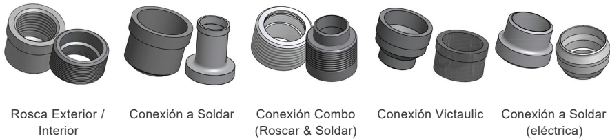
Rosca Exterior / Interior Conexión a Soldar Conexión Combo (Roscar & Soldar) Conexión Victaulic Conexión a Soldar (eléctrica)

*Para dimensiones específicas o para obtener información sobre otros tipos de conexiones, póngase en contacto con su representante de ventas de SWEP.