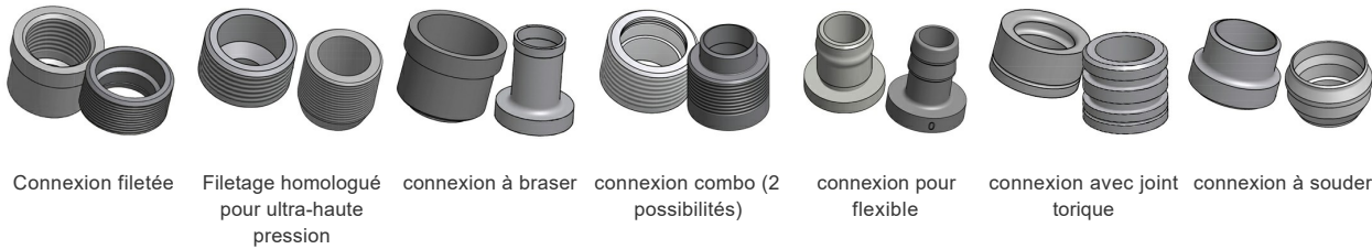
Connexion filetée Filetage homologué pour ultra-haute pression connexion à braser connexion combo (2 possibilités) connexion pour flexible connexion avec joint torique connexion à souder

*Pour obtenir d'autres informations, incluant les dimensions spécifiques et les différents types de raccords, veuillez contacter votre représentant SWEP.