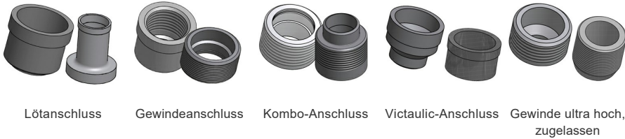
Lötanschluss Gewindeanschluss Kombo-Anschluss Victaulic-Anschluss Gewinde ultra hoch, zugelassen

*Spezifische Abmessungen und weitere Informationen über andere Anschlussarten erhalten Sie von Ihrem SWEP-Handelsvertreter.