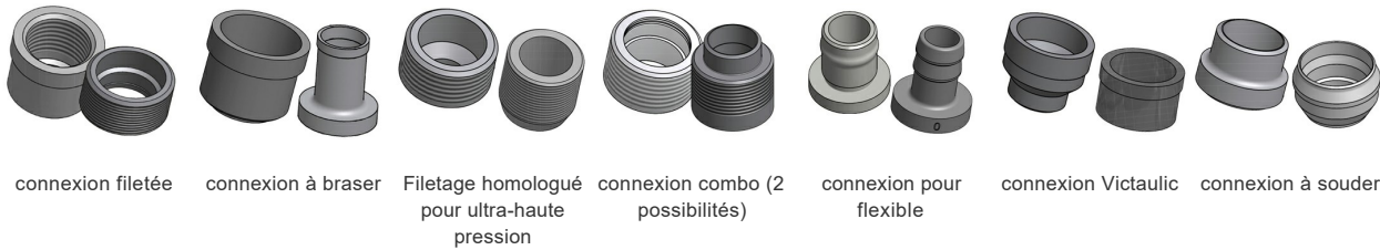
connexion filetée connexion à braser Filetage homologué pour ultra-haute pression connexion combo (2 possibilités) connexion pour flexible connexion Victaulic connexion à souder

*Pour obtenir d'autres informations, incluant les dimensions spécifiques et les différents types de raccords, veuillez contacter votre représentant SWEP.