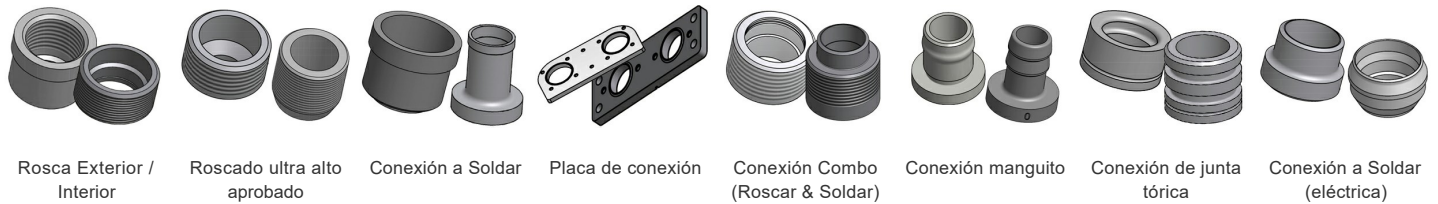
Rosca Exterior / Interior